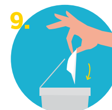
9. Tirar el papel desechable a un basurero con tapa de pedal y, si es posible, con bolsa de plástico, y cerrar el basurero.