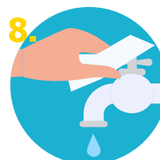
8. Cerrar la llave con la propia toalla de papel desechable.