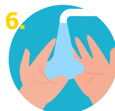
6. Enjuagar con abundante agua.