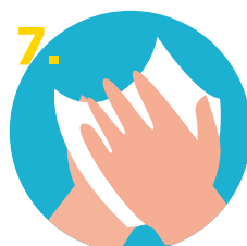
7. Secar las manos con una toalla de papel desechable.