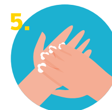
5. No olvidar frotar entre los dedos y bajo las uñas.