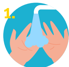
1. Mojar las manos con agua.