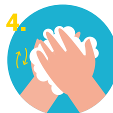
4. Frotar las manos.